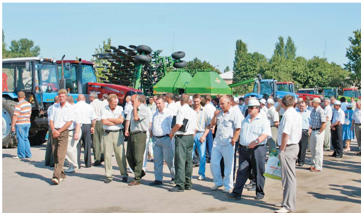
Учасники наради-семінару на території філії «Сватівська» ТОВ СП «НІБУЛОН»

передник – люцерна. Сівалка Great Plains. Посіяно насіння еліти, супереліти і першої репродукції. Зокрема, посіяно чотири сорти донецької селекції – урожайність очікується на рівні 70-80 ц/га, 3 сорти харківської – 65-70