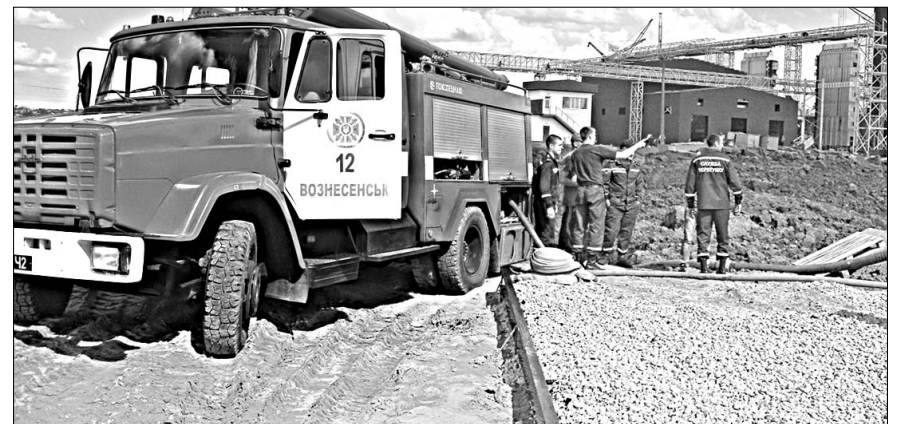
В помощь строителям была привлечена команда спасателей 12 ДПРЧ Государственной службы Украины по чрезвычайным ситуациям Николаевской области