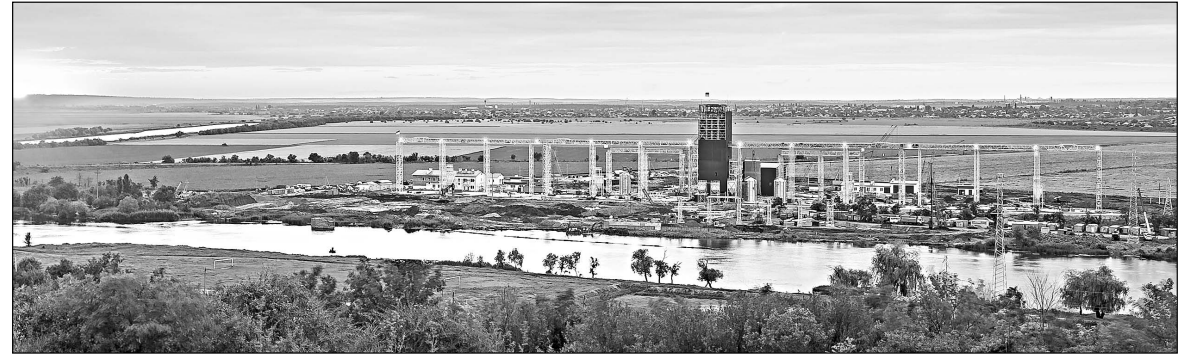
Общий вид строительной площадки

Некоторые трудности возникли только при строительстве причала, но «НИБУЛОН» предоставит подрядчику свою технику и поможет ему подтянуться по срокам, ведь уже на нынешней неделе на терминал прибудет британская судопогружная машина.