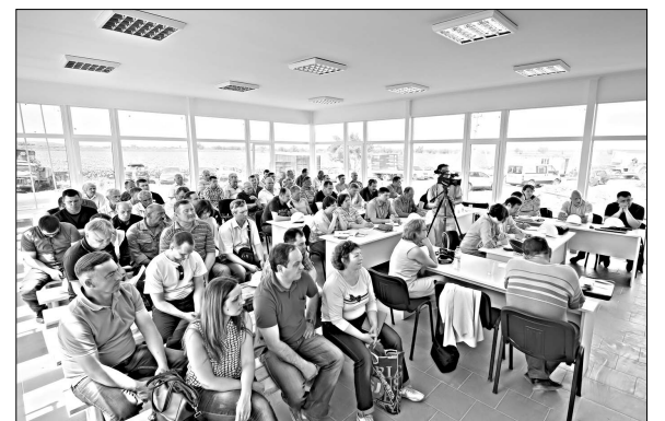
Производственное совещание на площадке

Виталий СИНЯВСКИЙ, «Николаевские новости», Вознесенский район