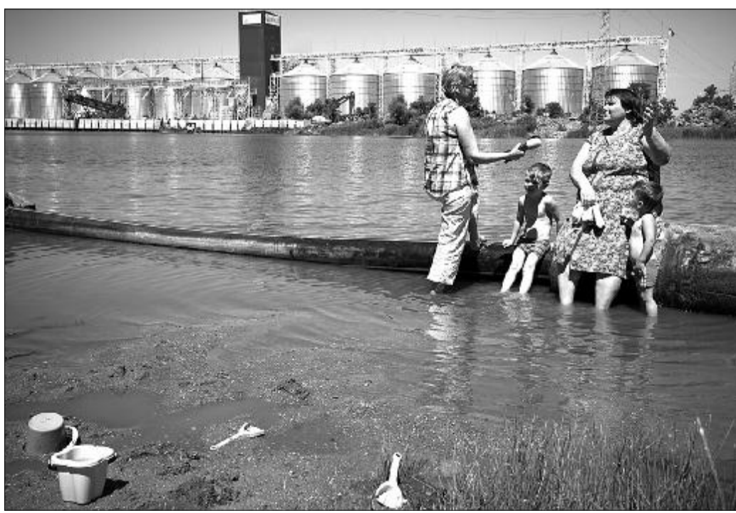
Местные жители поддерживают инвестиционный проект компании «НИБУЛОН»

Рабочая группа, посетив места, где компанией «НИБУЛОН» ведется дноуглубление в Прибужанах, а затем в Баловном, где эти работы уже завершены, не увидела «варварского уничтожения прибрежной зоны в Вознесенске», о котором предупреждала общественность николаевская блогер, зато отметила наличие краснокнижных кукушкин