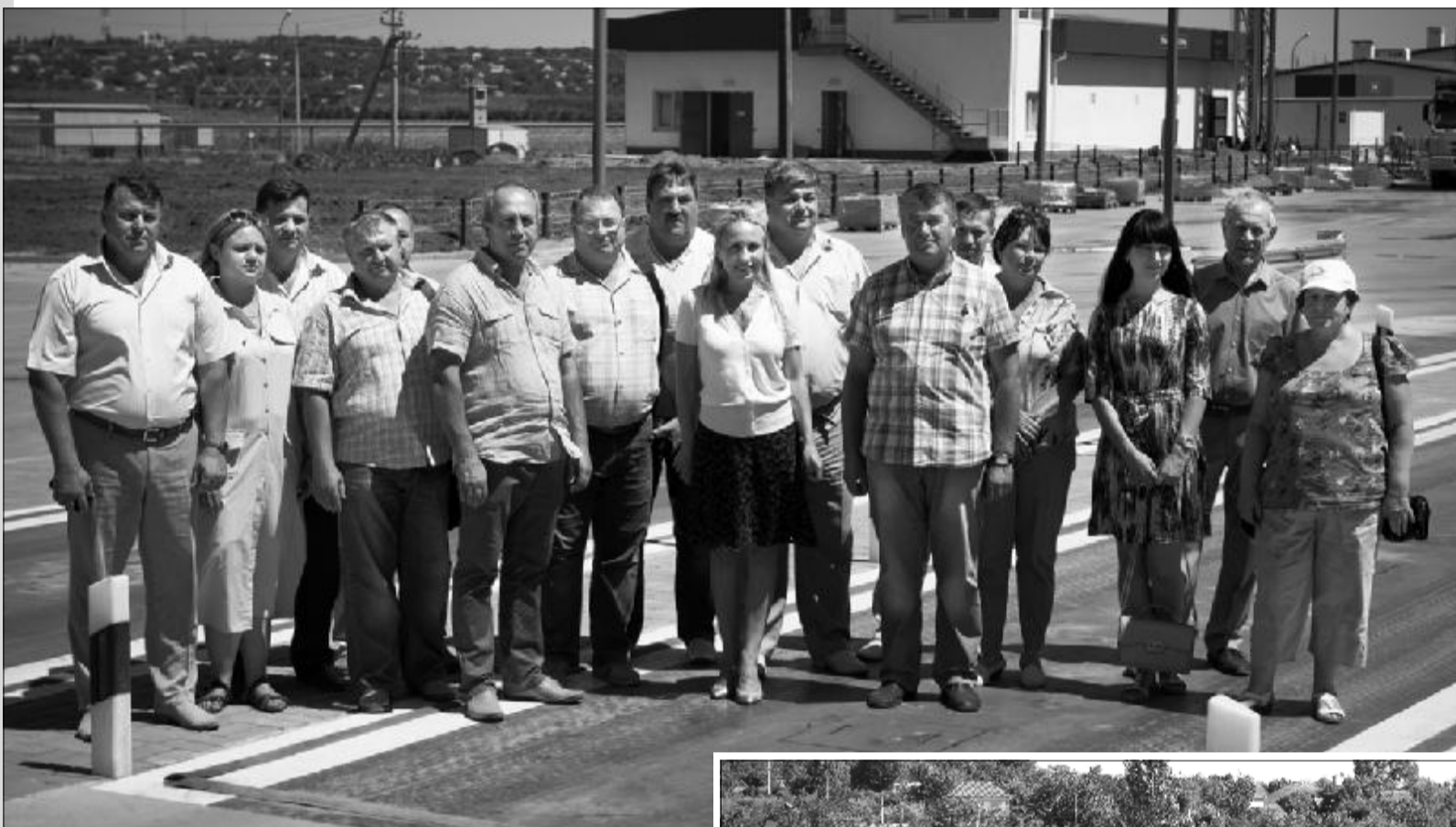
Рабочая группа на перегрузочном терминале филиала «Вознесенский»

О масштабном инвестиционном проекте, который осуществляет компания «НИБУЛОН» в Вознесенском районе - строительстве современного высокотехнологичного перегрузочного терминала вблизи села Прибужаны Вознесенского района всего за 100 рекордных дней, которые сопровождались проливными дождями и палящим солнцем, украинская пресса писала не раз. Уникальность проекта состоит в том, что он охватывает сразу несколько отраслей - транспортную, строительную, судостроительную и агропромышленный комплекс. Параллельно со строительством элеватора «НИБУЛОН» возрождает судоходство по Южному Бугу, строит несамостоятельные суда на своем судостроительном-судоремонтном заводе, спроектированные специально для перевозки зерна и других грузов по реке, проводит дноуглубительные работы, расчищая и углубляя русло Южного Буга. Именно деятельность «НИБУЛОН» по дноуглублению попала в поле пристального внимания на интернет-просторах. И хотя большинство активных пользователей поддерживает проект компании, нашлись несколько, так сказать, недовольных.