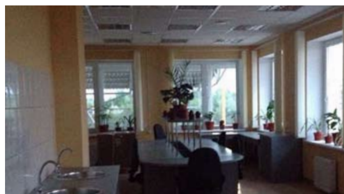
Помещения административно-лабораторного корпуса.