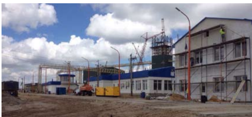
Основные здания филиала «Голопристанская».