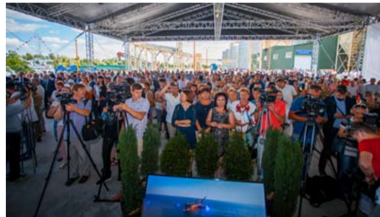
До торжественного открытия терминала остались считанные минуты.