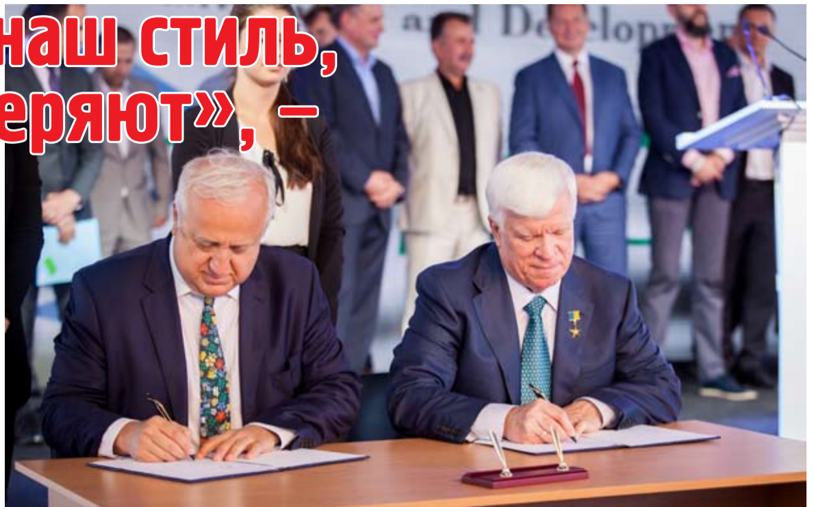
Подписание кредитного соглашения с ЕБРР

Здесь – это праздник компании «Нибулон», а во Франции – это национальный праздник (День взятия Бастилии. – Ред.). Проект такого размаха, осуществлённый украинской компанией, и проделанная ею работа – это то, о чём мы рассказываем французским компаниям, говоря о чрезвычайных перспективах украинского рынка и возможностях для инвестиций в Украину. Украина и Франция – самые большие аграрные страны в Европе, поэтому вполне естественно, что они должны осуществлять совместные проекты. И я рад, что французская фирма, которая изготавливает весовое оборудование, – один из лидеров в своём секторе, также включилась в реализацию этого проекта. И мы надеемся, что другие французские компании тоже смогут участвовать в Украине в новых инфраструктурных проектах. Мы в радости предоставим возможность для коммуникации с ними.