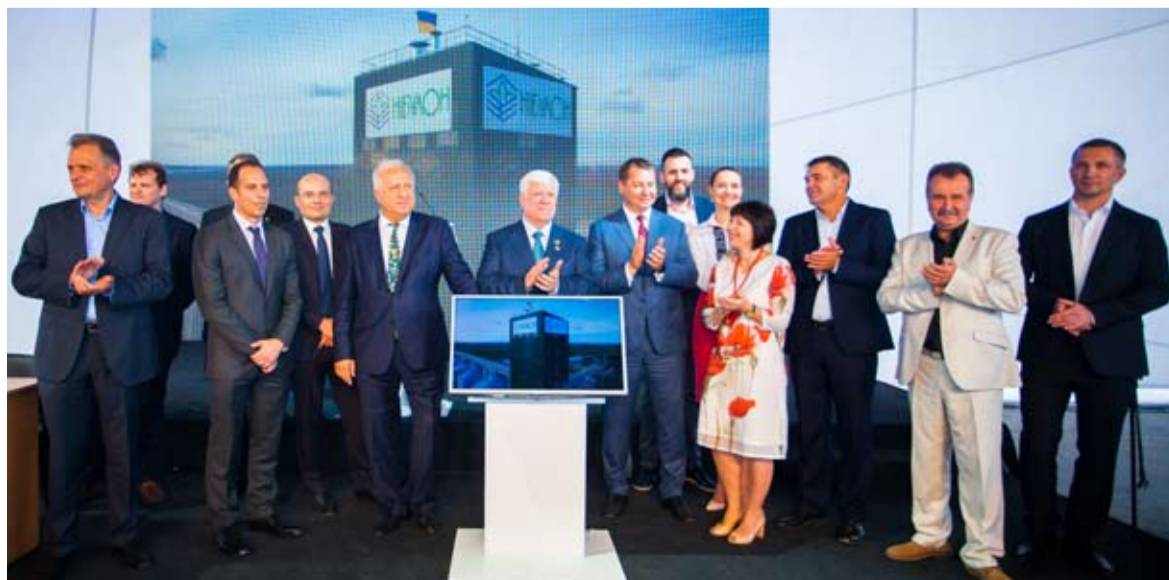
Торжественное открытие терминала