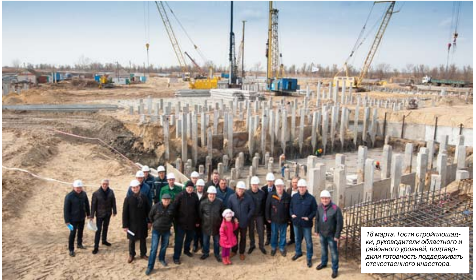
18 марта. Гости стройплощадки, руководители областного и районного уровней, подтвердили готовность поддерживать отечественного инвестора.

- Сейчас на строительной площадке работает 24 строительных организации из Херсонской, Николаевской, Одесской, Днепропетровской и Киевской областей, в мае их