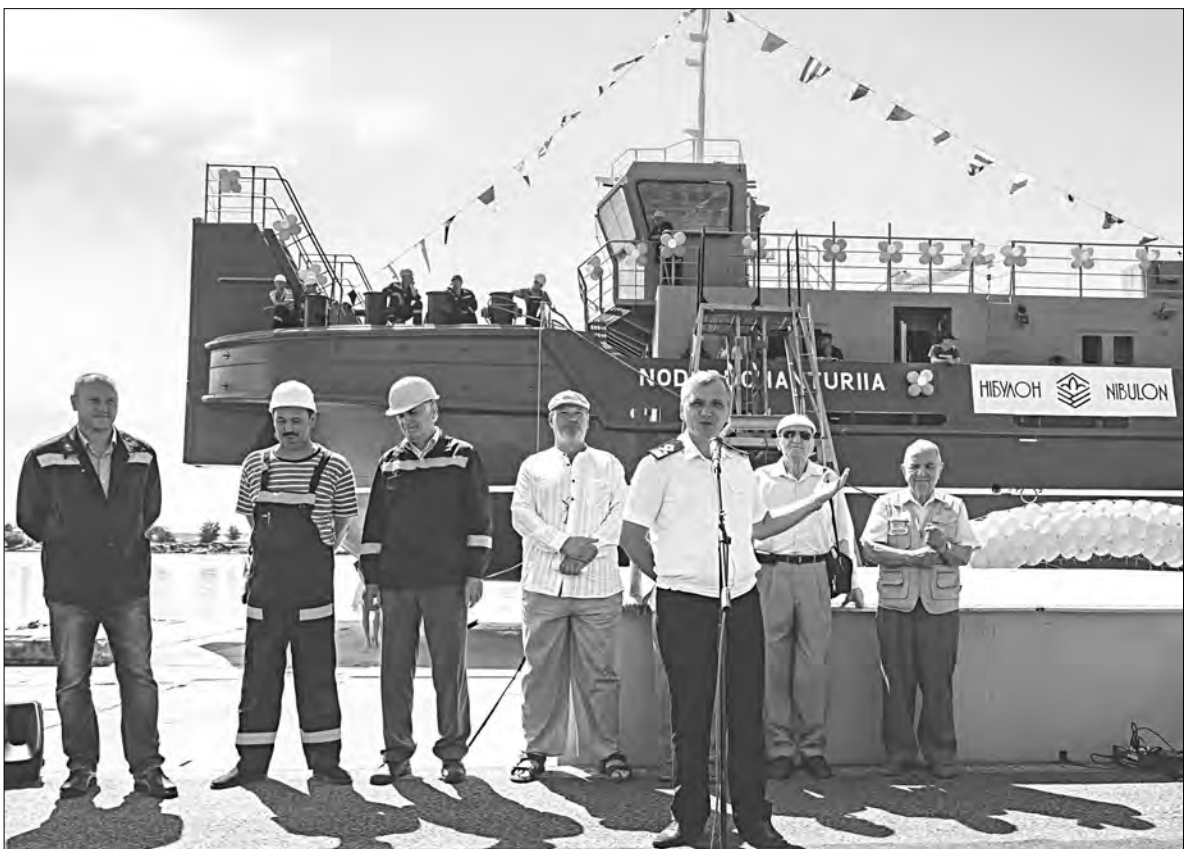
Митинг на торжественной церемонии спуска на воду буксира «Нодари Чантурия»