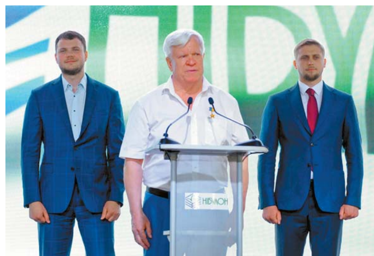
Виступає Герой України Олексій ВАДАТУРСЬКИЙ

Голова Дніпропетровської ОДА Олександр Бондаренко підкреслив, що «НІБУЛОН» відповідає всім трьом ключовим пріоритетам із залучення інвестицій в область, які сформулювала для себе місцева влада, — економіка, інфраструктура, екологія. «Це екологічний проект, адже розвантажуючи автодороги