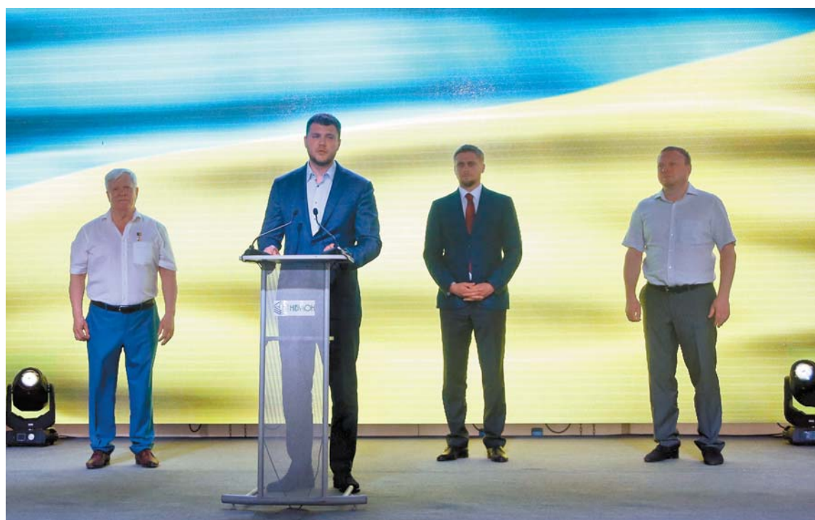
Урочисте відкриття перевантажувального терміналу філії «Зеленодольська» ТОВ СП «НІБУЛОН». На сцені (зліва направо): генеральний директор ТОВ СП «НІБУЛОН» Олексій ВАДАТУРСЬКИЙ, міністр інфраструктури України Владислав КРИКЛІЙ, голова Дніпропетровської облдержадміністрації Олександр БОНДАРЕНКО, голова Дніпропетровської облради Святослав ОЛІЙНИК

Зокрема, тут забито 3311 палів (довжиною близько 56 км), забетоновано близько 25 тис. кв. м площ, змонтовано більше 5000 тонн металокопункцій, прокладено понад 6,5 км мереж водопроводу та каналізації, більше 7,5 км мереж газопостачання та понад 95 км мереж електропостачання, автоматики та сиг-